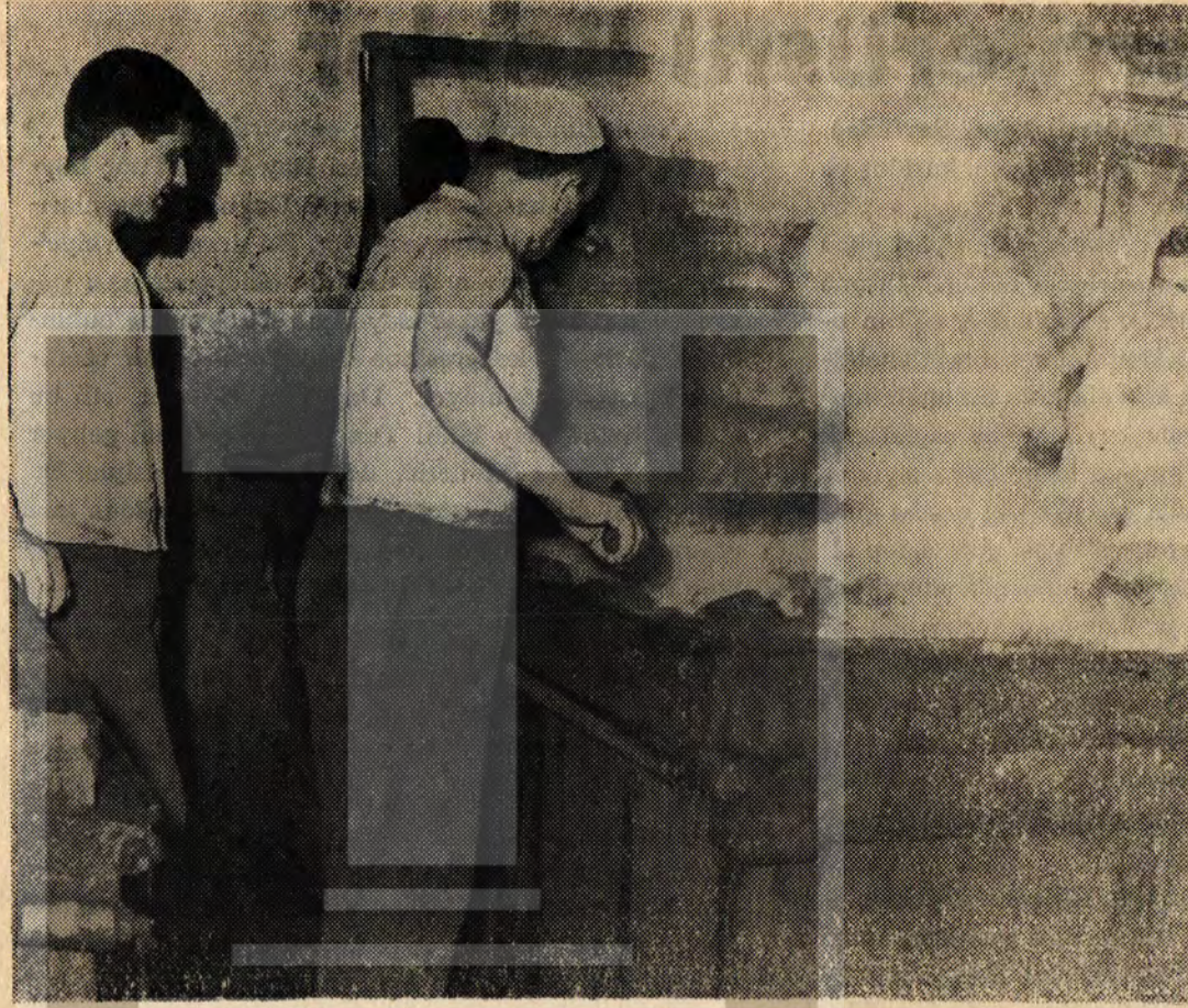
Çıkan asit dumanlarıdır, emekçinin ciğerine dolar

D evlet sektörünü savunuruz.. Memleketin ekonomik yapısında mühim yeri vardır. Bu sektördeki işletmelerin hizmeti muhtelif cephelidir. Özel sektör onu kıskanır. Elinde gelse devlet sektöründeki işletmelerin kolunu kanadını budar. O'na hayat hakkı tanımaz. Ama devlet sektörü olmasa idi kendisi bugün kü inkişafa kavuşamazmış düşünmez. Eğer özeller biraz ince ele-yip sık dokusa devlet sektörüne minnet ve şükran borçlu olduklarını kabullenirlerdi. Zira her şeyden evvel eğitim ocağıdır. Bugün işkolumuzdaki Özel Sektöre ait işletmelerin elemanları genellikle Sümerbanktan yetişmişlerdir. Sümerbank fabrika kurduğu şehirlerimizde vatandaşlarımızı sanata adapte etmiştir.. Önce mesleksiz işe başlayanların sivriliplik sorumluluk mevkilerine geldiklerine şahidiz. Halen özel sektöre ait işletmelerin kaliteli noktalarını bu ele-manlar işgal ediyorlar.