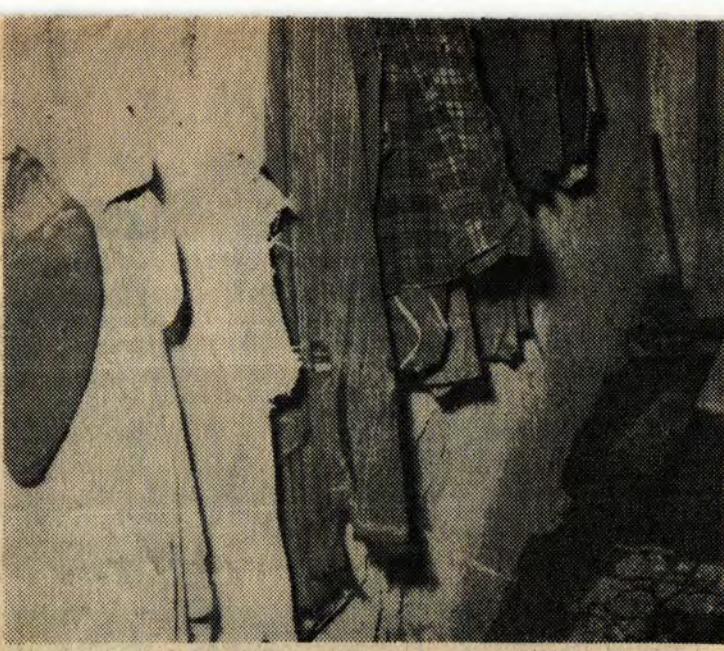
İşte soyunma yeri